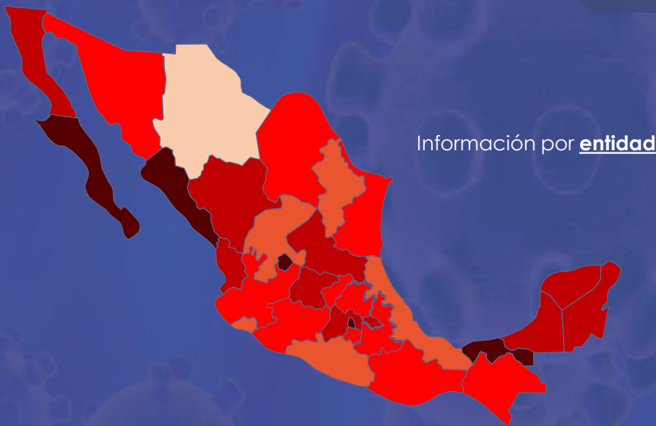
Información por entidad