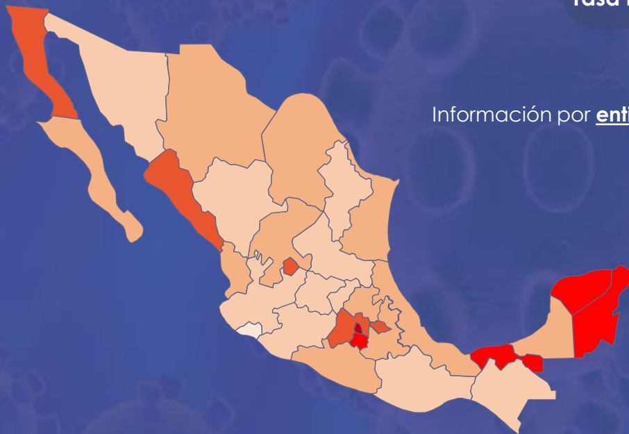
Información por entidad